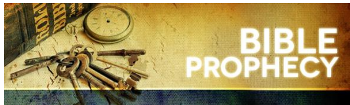
Bilde 1 Bibelske profetier

Bibelen ble skrevet over en periode på mer enn 1600 år av mer enn 40 ulike individer som ble inspirert av Gud: «Hver bok i Skriften er innblåst av Gud og nyttig til opplæring, tilrettevisning, veiledning og oppdragelse i rettferd» (2 Tim 3v16). I mange av disse bøkene inspirerte Guds Ånd mennesker til å bringe fram profetiske budskap fra Gud: «For aldri ble noen profeti båret fram fordi et menneske ville det, men drevet av Den hellige ånd talte mennesker ord fra Gud» (2 Pet 1v21).