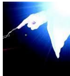
Bilde 3 I begynnelsen skapte Gud himmelen og jorden

«Han er den usynlige Guds bilde, den førstefødte før alt det skapte. 16 For i ham er alt blitt skapt, i himmelen og på jorden, det synlige og det usynlige, troner og herskere, makter og åndskrefter - alt er skapt ved ham og til ham» (Kol. 1v15-16)